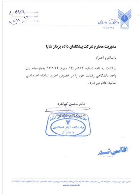
دانشگاه آزاد اسلامی واحد مبارکه