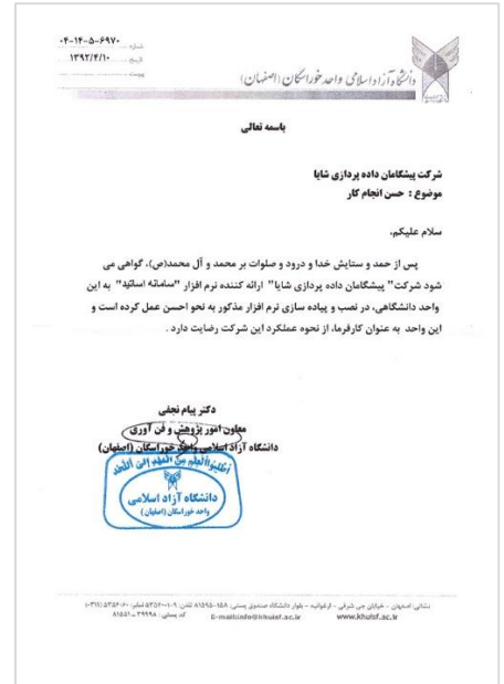
دانشگاه آزاد اسلامی واحد اصفهان